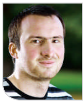
PIŠE: ALEŠ PREGL

Posledice globalne finančne in gospodarske krize je med prvimi in najbolj občutil prav nepremičninski trg. Mariborski, ki je v preteklih letih dožviljal pravo ekspanzijo, ni bil izjema. Zdaj naj bi se zelo počasi, a zanesljivo pobiral. Kaj pa cene? Velikega padca, ki so ga kupci pričakovali, ni bilo. Slišati pa je, da bodo cene, potem ko bodo zaloge pošle, hitro zrasle.