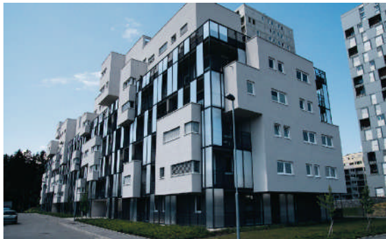
V Mariboru se na mesec v povprečju proda do deset stanovanj.

Nepremičninske so v Mariboru v času blaginje rasle kot gobe po dežju. Tega so se veselili vsi – kupci, prodajalci in investitorji. Kupci so sicer benutili nad cenami, a vseeno kupovali. Zelo hitro pa se je opazila njihova previdnost in morda spekulativnost. Vsi so namreč upali, da bodo cene opazno padle. Vendar niso. Po besedah investitorjev in njih namreč ni več rezerv. Trg pa se počasi prebujata. To bi lahko pripisali več dejavnikom.